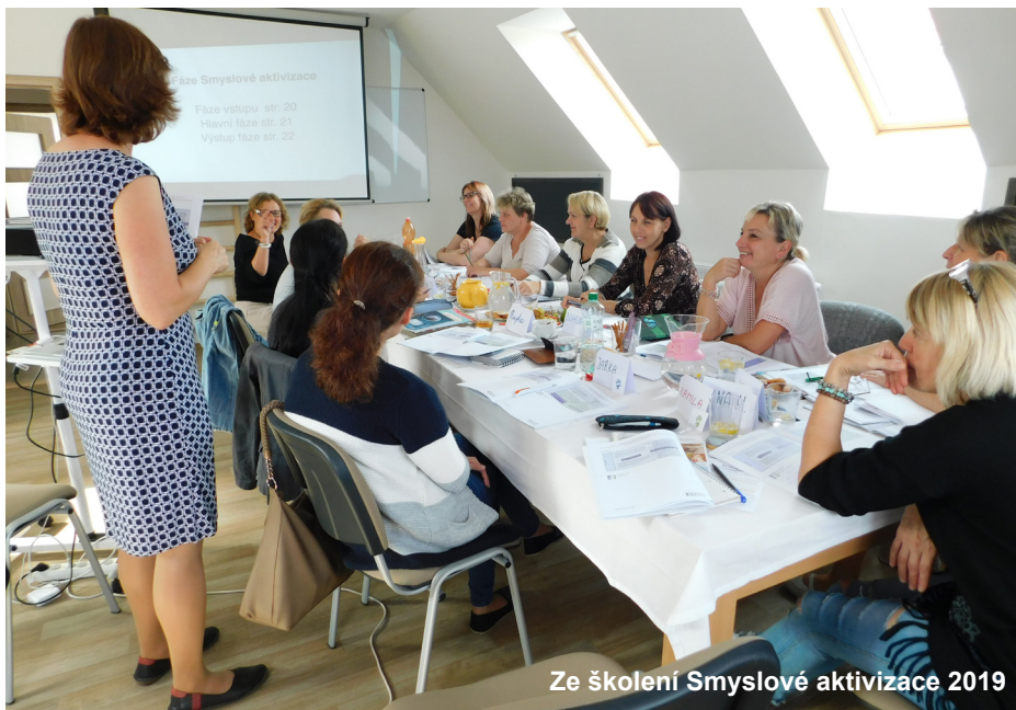
Ze školení Smyslové aktivizace 2019

5. června je Den rozvoje a vzdělávání dospělých. A právě vzdělávání je tématem tohoto čísla. V květnu proběhlo několik školení, a jak se přesvědčíte dále v článku, byla zaměřená nejen na potřeby služby či klientů, ale i samotných zaměstnanců.