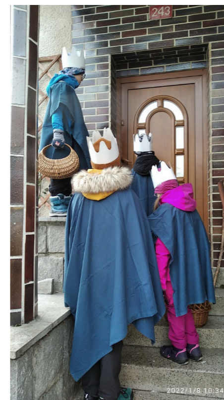
4. Když jsi malý