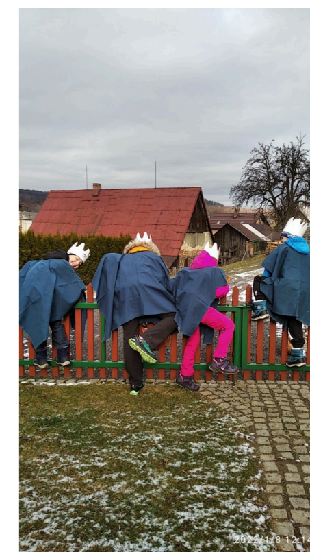
3. Když je tam pes