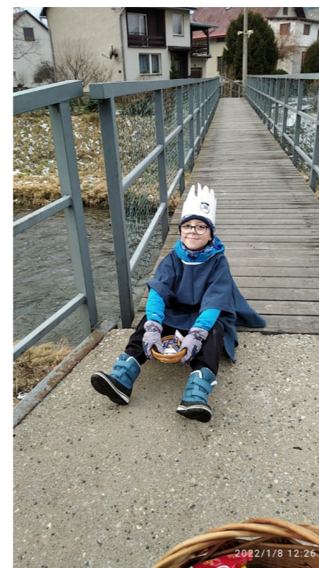
1. Když už nemůžeš