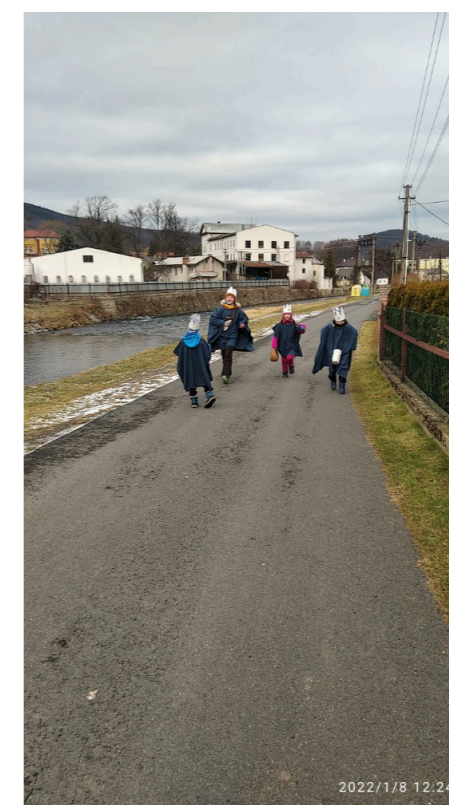
2. Když zakopneš