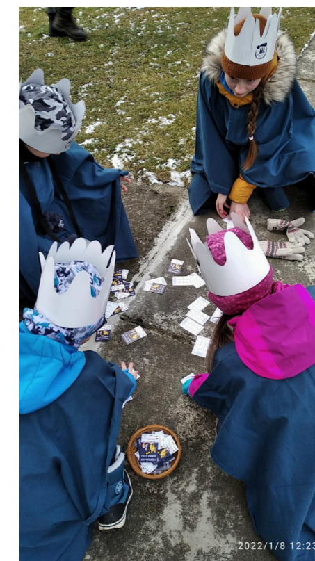
6. Když jste čtyři

Fotografie a popisky nám dodala Angelika Šalplachtová