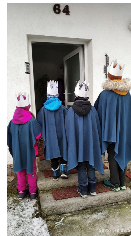
5. Když je ti zima