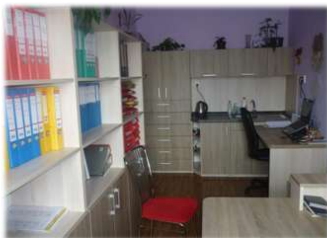
Nová kancelář Vývařovny