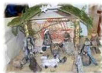
IV. kategorie ZUŠ Vidnava