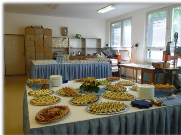
Raut u příležitosti slavnostního zahájení nové výroby ve společnosti UNITA s.r.o. v Bílé Vodě