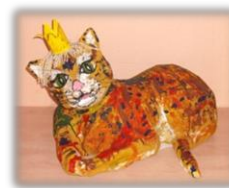
Cena poroty děti z MŠ Velká Kraš