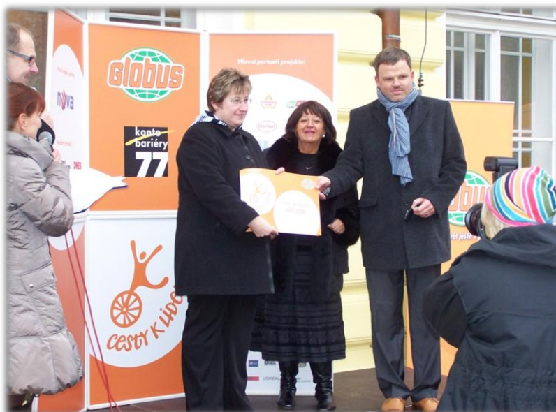
Předání šeku na nový automobil