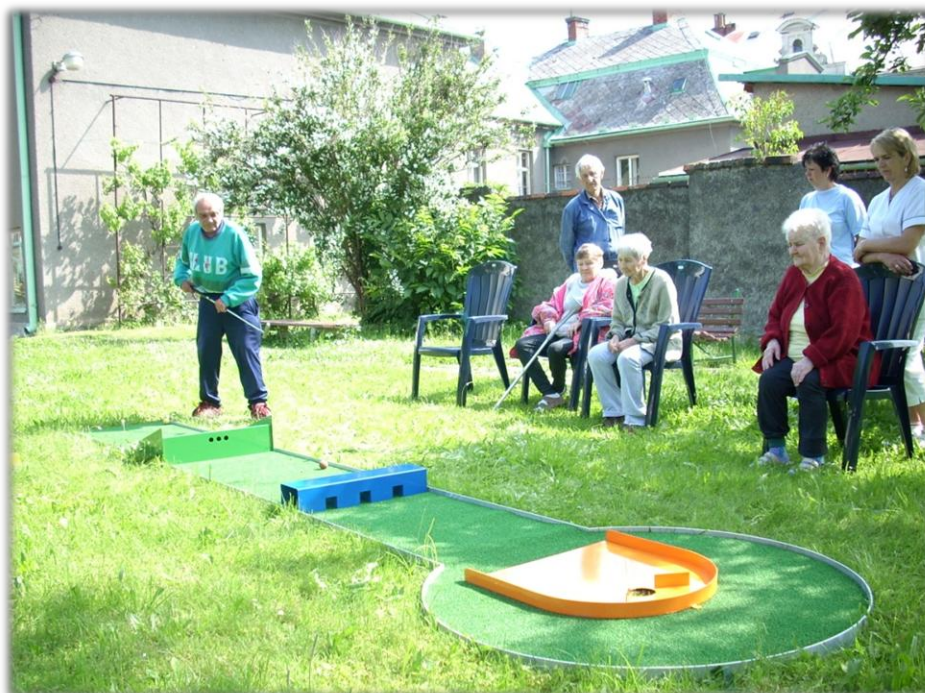
Trénujeme na turnaj