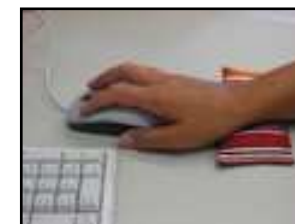
Podložka pod ruku (k počítači)