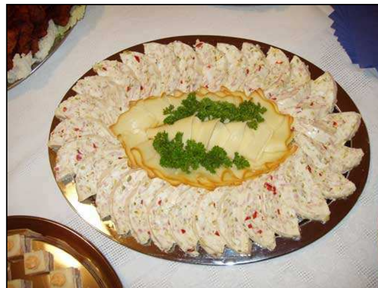
Raut ve Vidnavě