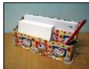
Zásobník na obálky