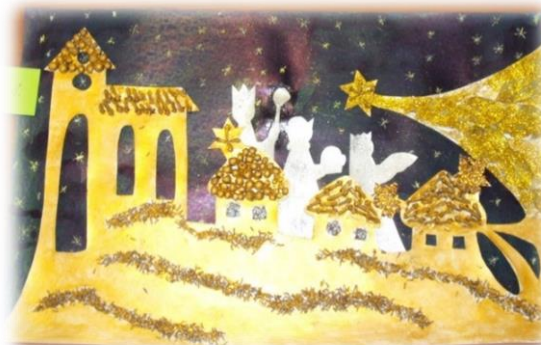
IV. kategorie MŠ Polská Javorník

Vyhlášení výsledků výtvarné soutěže a předání diplomů a cen vítězům proběhlo v březnu 2013 v jesenickém kině POHODA. Současně byly znovu prezentovány výsledky Tříkrálové sbírky 2013. Poté mohli všichni jako poděkování za pomoc při koledování zhlédnout pohádku „Čtyřlístek ve službách krále“. Při odchodu z kina byly všem předány drobné dárečky.