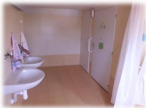
Nové koupelny v Domově pokojného stáří sv. Hedviky ve Vidnavě

Na přelomu května a června 2013 zasáhly Čechy ničivé povodně a vzhledem k jejich rozsahu jsme se rozhodli část výtěžku ve výši 10.000,- Kč věnovat na tyto účely. Finanční prostředky tak mohly být okamžitě použity na bezprostřední pomoc postiženým rodinám.